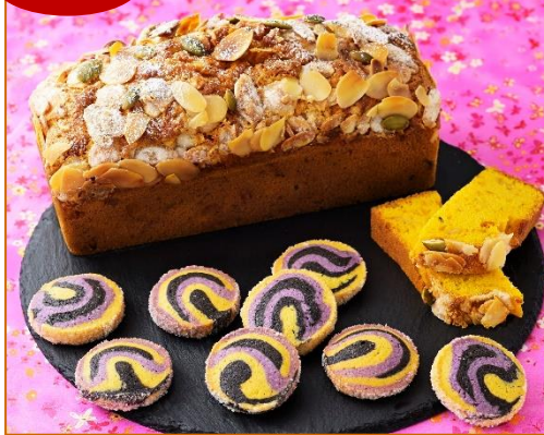
アーモンドのパンキンパウンド (19×7.5×高さ8.5cm) ハロウィンカラーのクッキー (直径4×厚さ0.9cm)

街にあふれるハロウィンカラーを取り入れ、作り方も意外とシンプル！この時期だけのワクワク楽しさあふれる旬体感メニューです！