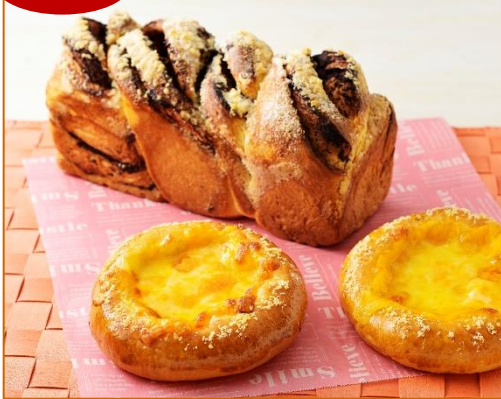
チョコレートバブカ (18×7.5×高さ9cm) クワトロチーズ (直径11×高さ2.5cm)

チョコレートバブカはガナッシュクリームをたっぷり使って濃厚に仕上げました。4種のチーズを贅沢に使ったクワトロチーズは焼き立てをぜひ味わってください。