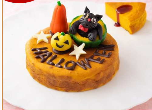
黒猫のハロウィン (直径12×高さ10cm)

かぼちゃのチーズケーキの上に黒猫、かぼちゃをセッティング。ハロウィンパーティーにお勧めです。