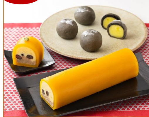
かぼちゃ (16×4.5×高さ3.5cm) まんまるお月様 (直径4.5×高さ4cm)

かぼちゃ羊かんて2色の浮島を包んだ秋の味覚。切り口はかぼちゃが笑っているようにも見えるハロウィンにもピッタリな棗菓子と秋のお月見にも最適な中あんの栗あんが夜空に光るお月様のような焼きまんじゅう。