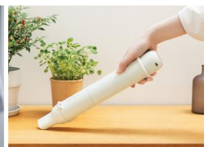
コードレス3wayクリーナー