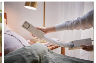
スティックフンドライヤー