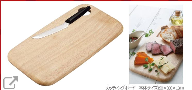
カッティングボード 本体サイズ190×350×15mm

食材をのせたまま卓上使いが出来る、ラバーウッド製のカッティングボードとテーブルナイフのセット。カッティングボードにはマグネットが内蔵されていて付属のナイフがきれいに収まり、滑り落ちにくくなっています。