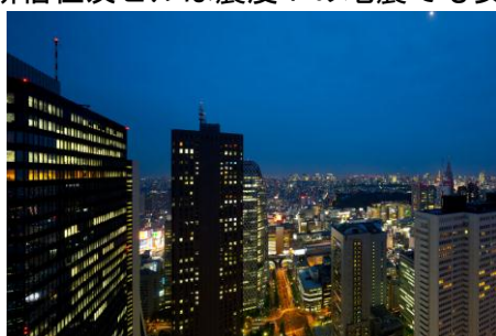
住友ビルから新宿方面の夜景