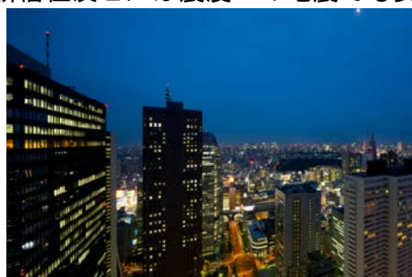
住友ビルから新宿方面の夜景