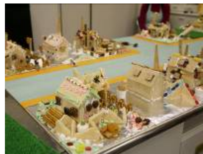
「おかしの家」を並べた街並み