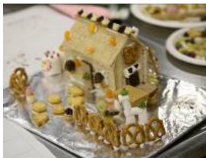
完成した「おかしの家」