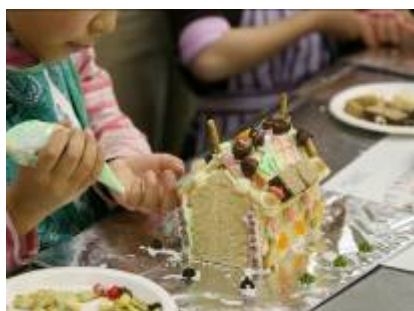
「おかしの家」を作る様子